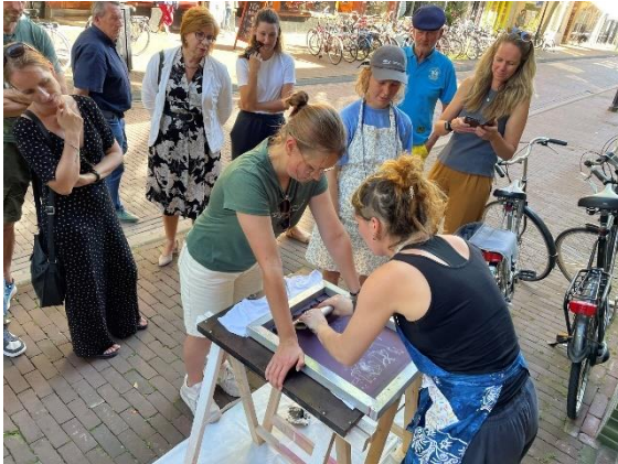
Opening NEW TREASURES; zeefdrukken en samenwerken