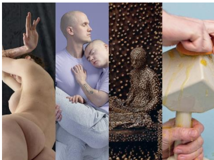
DE SCHOONHEID VAN KWETSBAARHEID